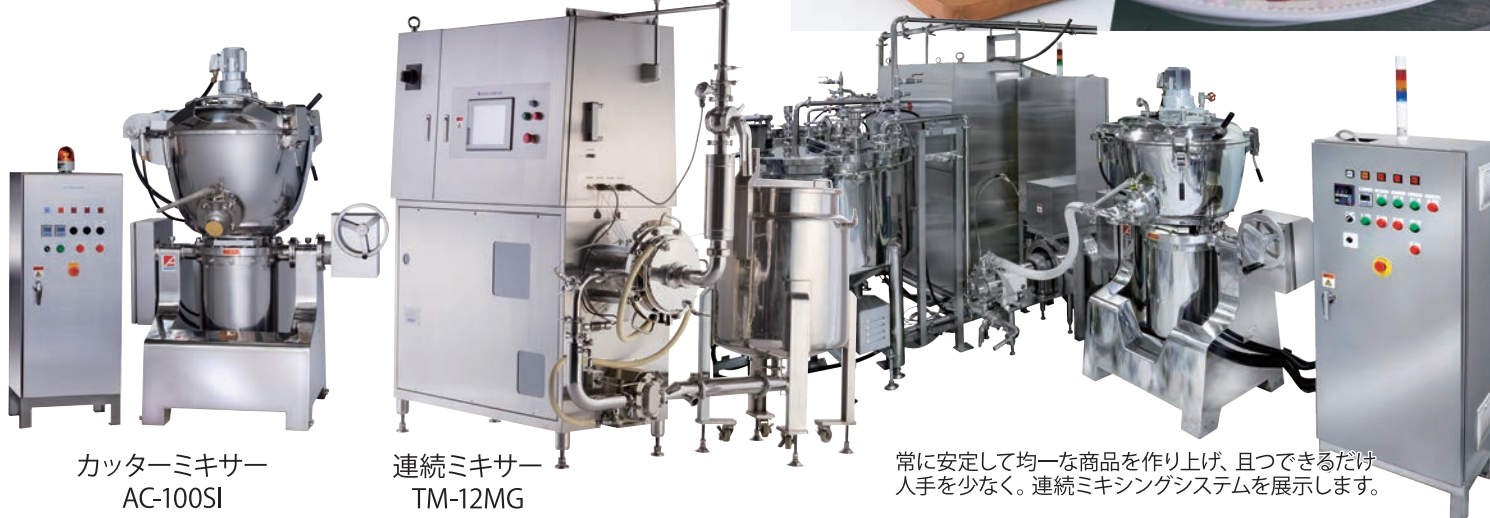
カッターミキサー AC-100SI