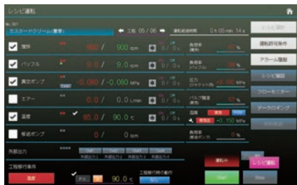
製品づくりの状況が一目でわかる操作パネル