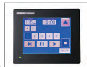
グラフィックパネル

操作感覚に優れたシートスイッチの「Vパネル」を標準装備。パネル操作で好みの回転数に自由に変更することができるので便利です。オプションで15工程30品目のレシピ登録ができるグラフィックパネルの装備も可能です。