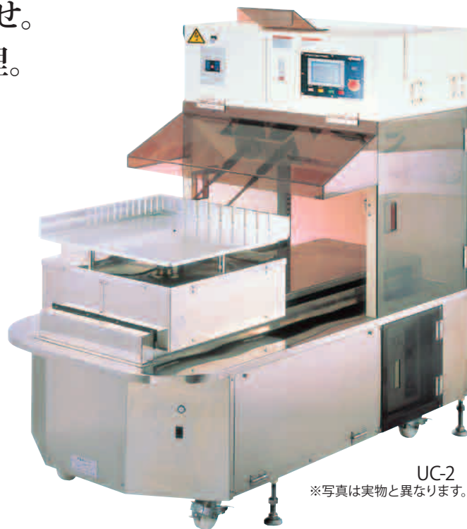
UC-2 ※写真は実物と異なります。

また、90度回転するターンテーブルを採用。ケーキのカッティング面の方向をチェンジできるため、従来のクロスカッターに比べ、設置スペースが半分程度のコンパクトな製品です。