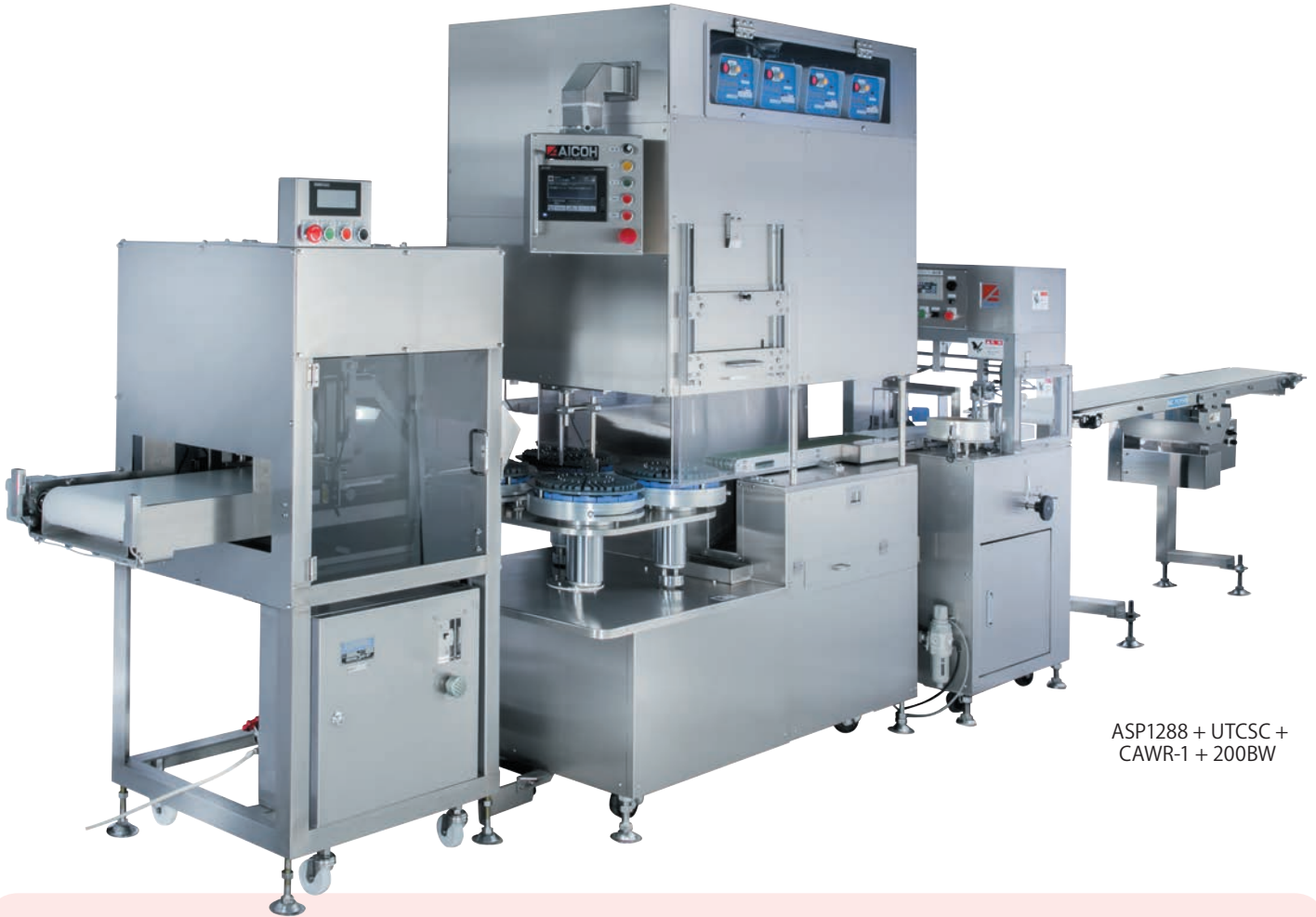
ASP1288 + UTCSC + CAWR-1 + 200BW