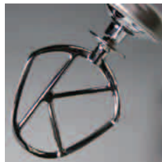
ステンレスビーター (op)