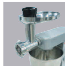
スーパーミンサー (op) (ソーセージフィラー付) KAX950ME