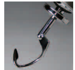
ステンレスフック (op)