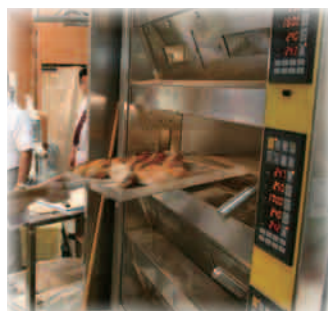
EL4.1216：右パネル・覗き窓仕様