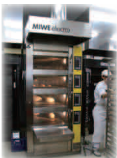
EL 4.0616：右パネル・ガラス扉仕様