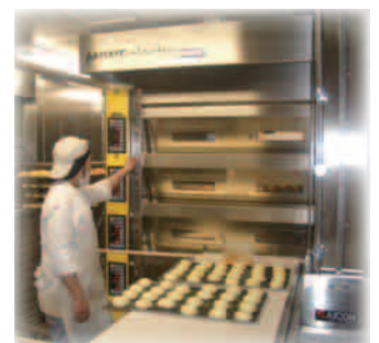
EL 4.1216：左パネル・覗き窓仕様