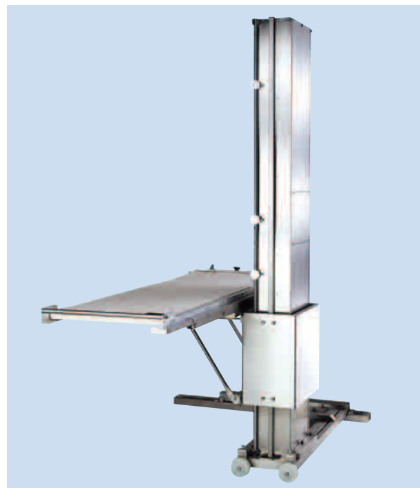
エレベーター(ベーカリーボーイ)