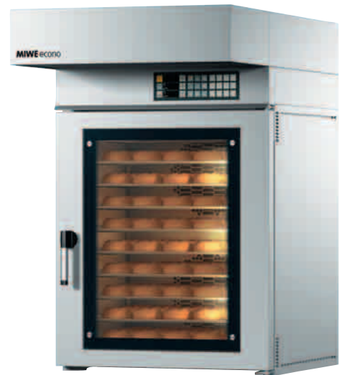
EC 10.0604 スチームフードファン仕様 (オプション)