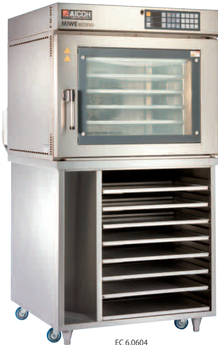
EC 6.0604 専用ラック仕様 (オプション)

焼成面積がたっぷり、スタイリッシュな外観はイン・ショップでの焼成にぴったりです。ホイロ後冷凍生地をそのまま入れて、スイッチを押すだけで焼き立てのパンを誰でも簡単に自動焼成することができます。各種製法のパン生地・冷凍生地や洋菓子の焼成などにおすすめです。