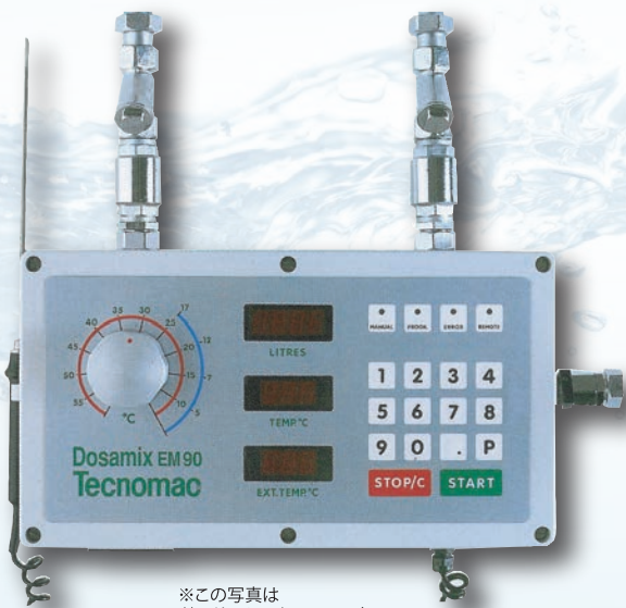
※この写真は ドーサーミックス 90 です。