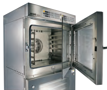
ガラス扉が二層構造のため、前面が熱くならず手で触れても安全。 ※画像は旧タイプです。